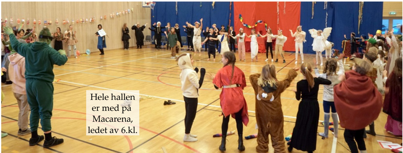
Hele hallen er med på Macarena, ledet av 6.kl.