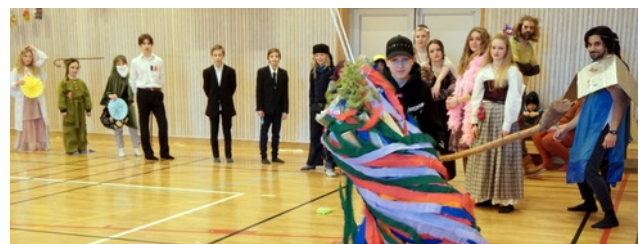
Etter utallige runder med slag, var det Gratas som satte inn nådestøtet og fikk ut de siste godteposene.