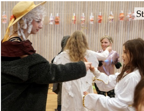
Stein – saks – papir