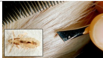
Foto- konkurransse, side 5

UKENS TAVLE er fra gamle Roma i 7. klasse, med en voksfigur av et kjent motiv i hjørnet.