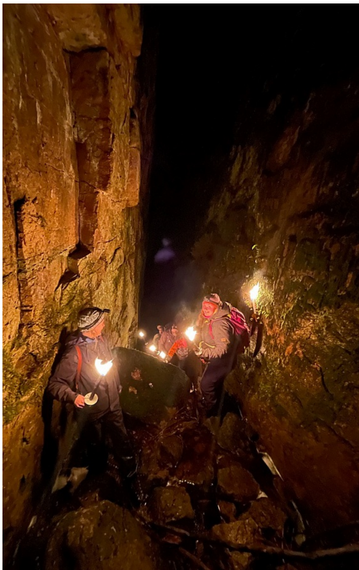
Fra juvturen i fjor

Med hilsen ungdomskollegiet – Vi gleder oss med fryd i hjertet.